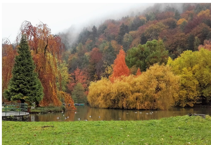
Krásný podzim přeje Výbor ALEN